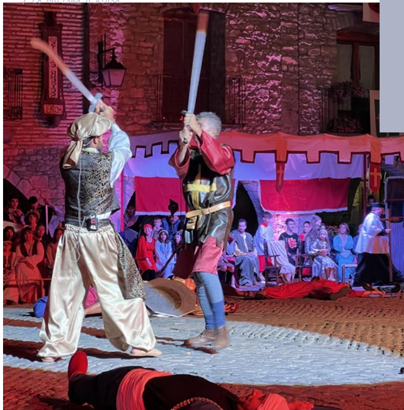
/ La Morisma d'Aínsa

Ce trail propose deux formats (11 km et 25 km) dans un environnement naturel préservé. Les participants évoluent sur des sentiers variés entre forêts et reliefs escarpés, offrant des panoramas spectaculaires.