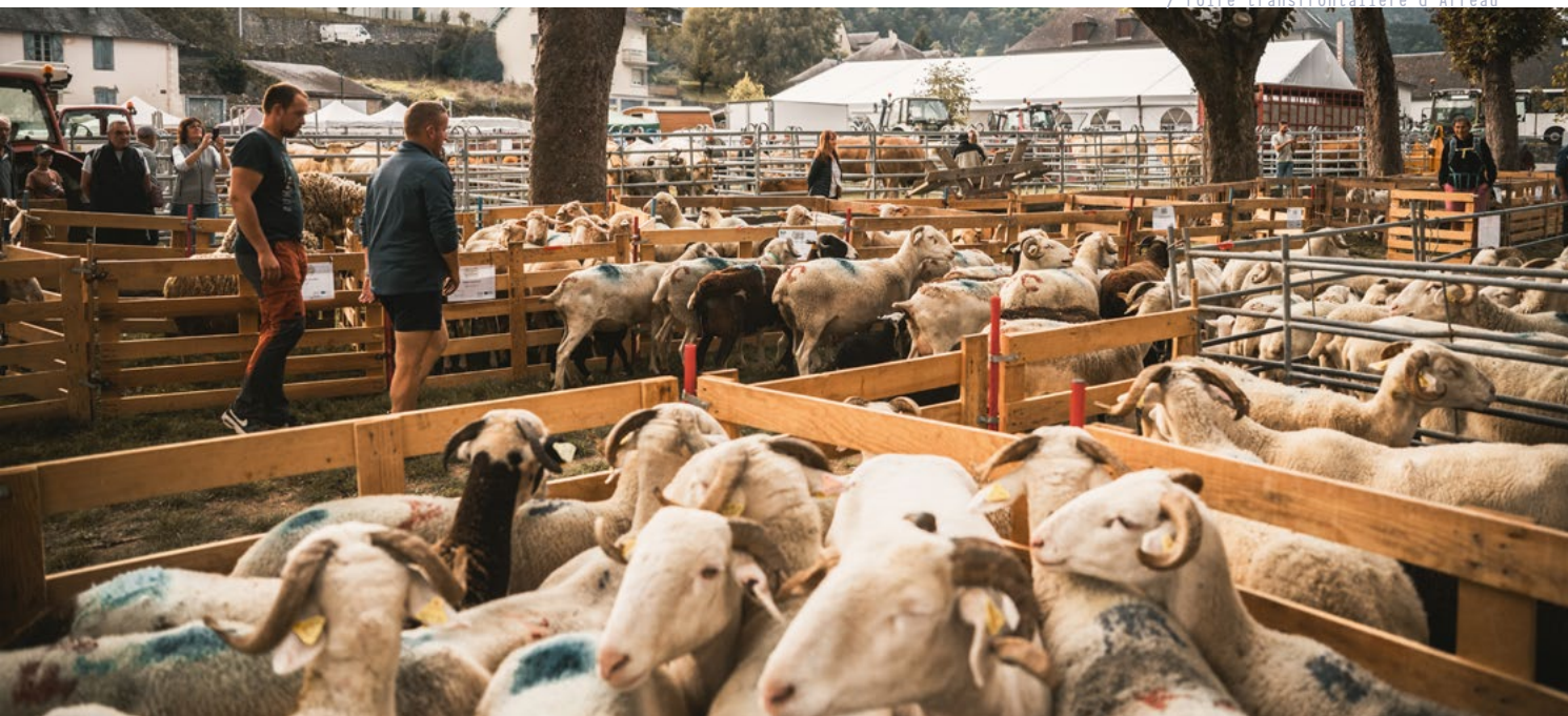
/ Foire transfrontalière d'Arreau

Rendez-vous à Génos pour une journée authentique, conviviale et pleine de saveurs locales ! Entre traditions pastorales, bons produits et chants pyrénéens, le village s'anima au rythme des animaux et du terroir.