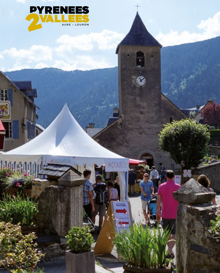
/ Festival Nature d'Aulon