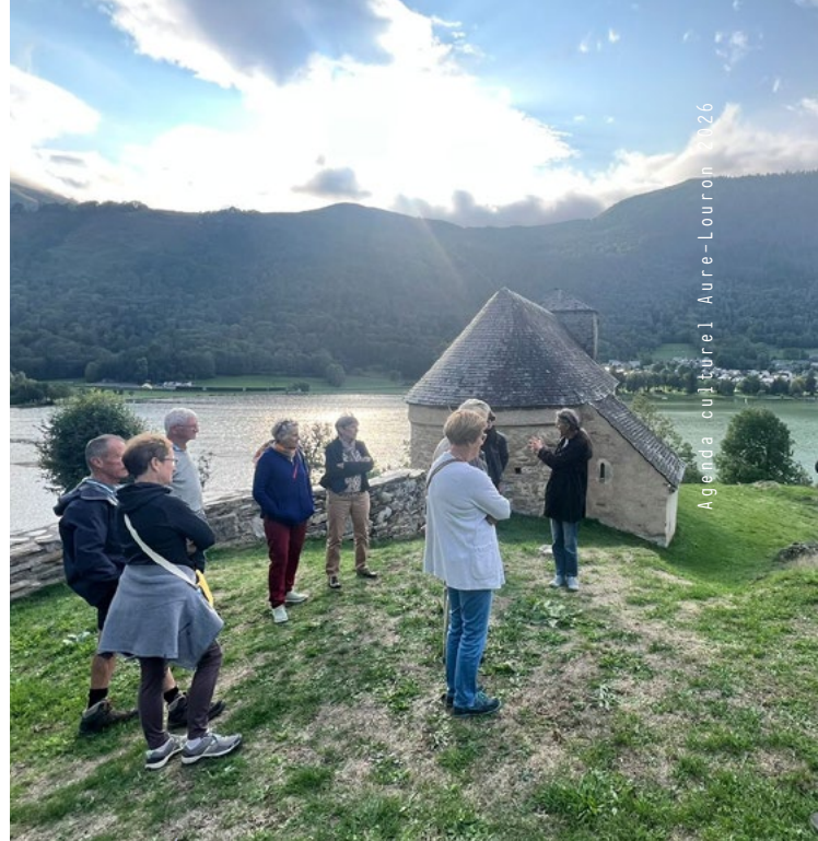
Agenda culturel Aure-Louron 2026

Foire aux bestiaux, producteurs locaux, repas fermier. Un rendez-vous économique et convivial autour de l'élevage.