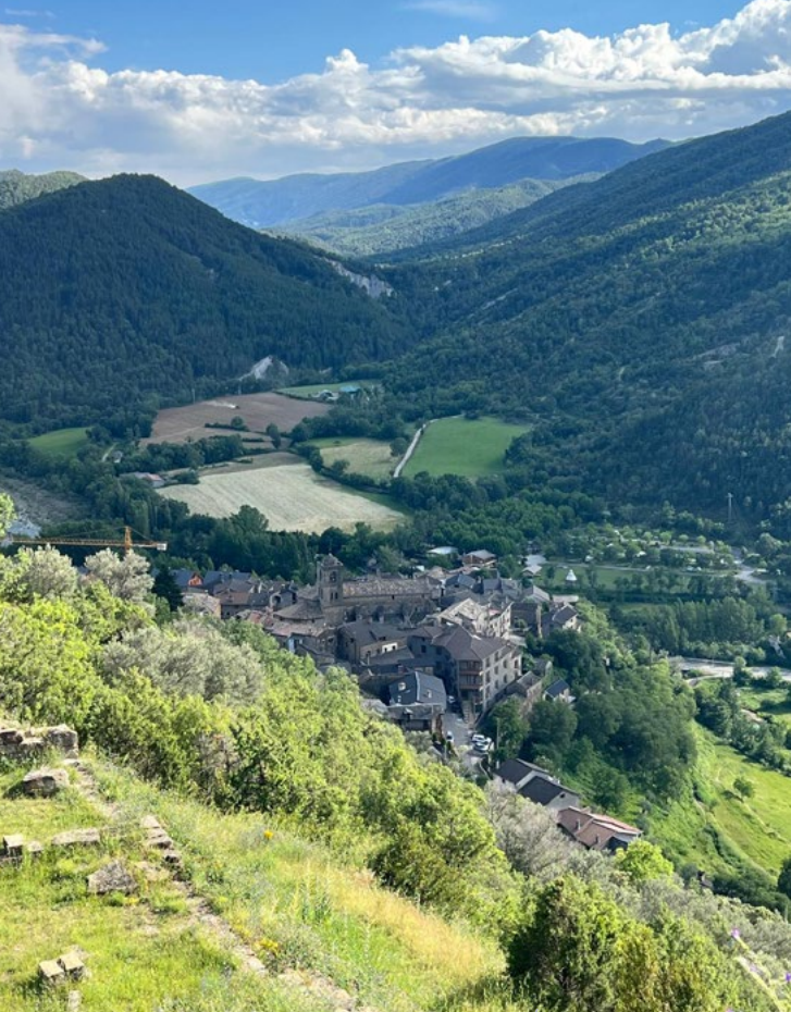
/ Village de Boltana