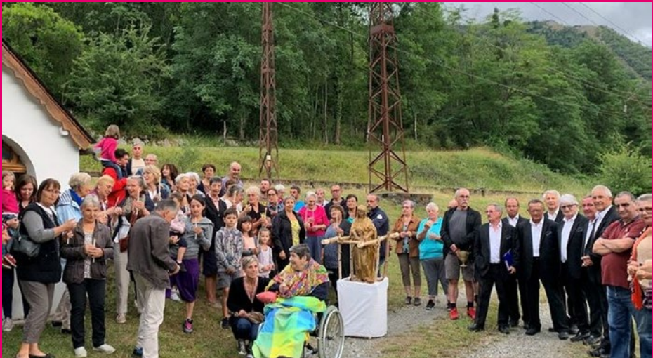
Procession de la Sainte-Anne à Ilhet

« La procession on la faisait pour la Fête-Dieu. On faisait le tour du village et on faisait des reposoirs. Les religieuses du Préventorium nous avaient fait des petites caissettes qu'on pendait au cou et on jetait des pétales de fleurs quand on s'arrêtait devant le reposoir. Il y avait trois ou quatre reposoirs dans tout le village. Tout était préparé par les religieuses, on chantait des chants religieux. » (Alberte - Guchen)