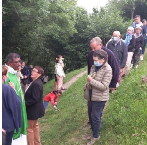
Procession de la Marie-Madeleine à Loudervielle