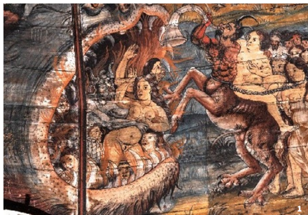
1. Jugement Dernier - Jézeau