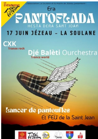
Affiche de la Pantoflada.

La crémation a lieu traditionnellement la nuit du 23 juin. Il fut un temps où avant le feu, la jeunesse organisait un repas avec les aliments collectés dans les maisons. Comme souvent il s'agissait d'œufs, ils fabriquaient une omelette ronde dont la forme rappelait celle de l'astre solaire. C'est l'occasion surtout de s'amuser, rondes, farandoles, cris et chants ponctuent la fête. Les musiciens sont là pour assurer l'ambiance. On peut aussi allumer de petits brandons que l'on fait tourner dans la nuit... Puis quand le feu du tronc s'amenuise on « saute le feu ».