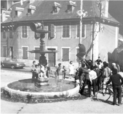
Le mât de Cognac à Cadéac

avec notamment visite des armoires, réserves alimentaires, jardin potager, etc.