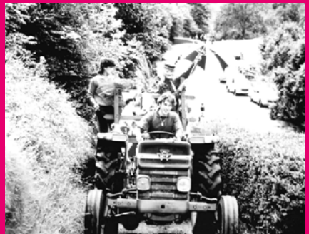
Les conscrits à Cadéac

La création de la conscription est apparue un peu partout en France, une tradition durant laquelle les jeunes adultes de chaque commune se réunissaient et faisaient la fête, avant de partir à l'armée. Cette tradition marquait en quelque sorte l'entrée dans le monde des adultes. À l'origine cette tradition était réservée aux hommes. Les fêtes de conscrits varient d'une région à une autre.