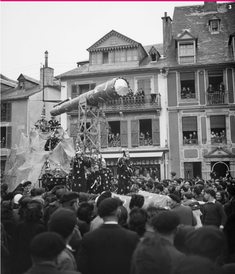
1. Char de la cavalcade à Arreau