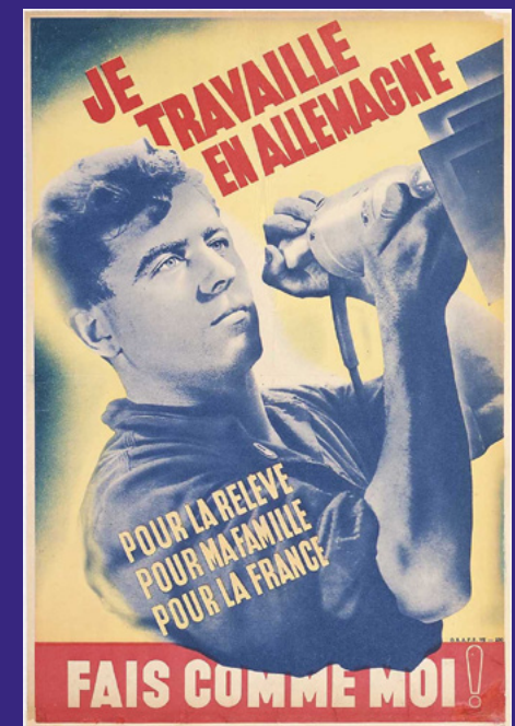
Affiche de propagande pour le STO

D'un point de vue politique, la vallée d'Aure est plutôt acquise aux radicaux de gauche et a bien adhéré au Front Populaire. L'esprit de résistance marque la majorité des habitants, et la population ouvrière, souvent étrangère aux vallées, propage les nouvelles idées des fronts de gauche opposés au régime de Vichy.