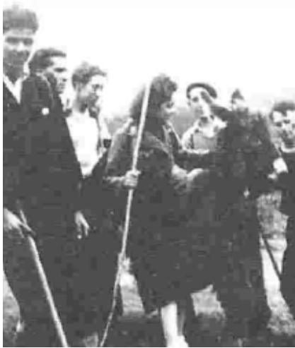
Simone Arnould