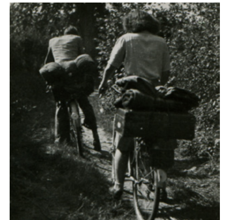
Les femmes à bicyclette, un maillon oublié de la Résistance