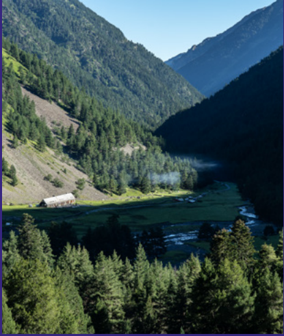
Rioumajou aujourd'hui

indiquent que ses activités, bien que clandestines, sont connues de tous. En voici un exemple :