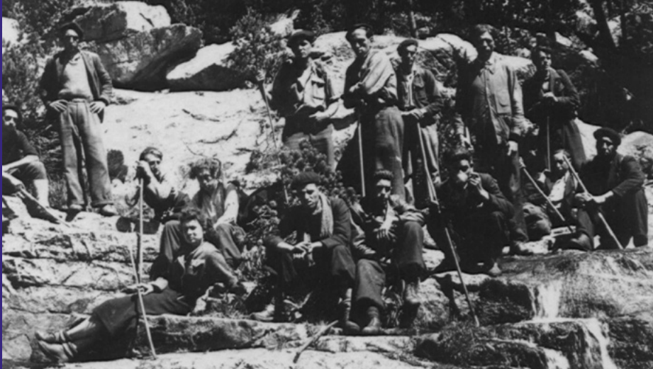
Groupe de Simone - Les Chemins que l'on ne peut oublier

“CETTE DIMENSION EXEMPLAIRE ET HÉROÏQUE DE LA RÉSISTANCE A EU POUR EFFET DE RELÉguer CEUX QUI L'ONT FAITE : LES RÉsISTANTS. LES QUELQUES HÉROS QUI DOMINENT CETTE MÉMOIRE ONT JETÉ UNE OMBRE SUR LES ACTEURS ANONYMES SANS QUI RIEN N'AUraIT ÉTÉ POSSIBLE.”