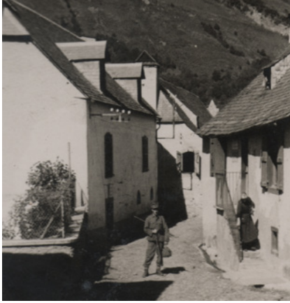
Soldat allemand dans la rue à Loudenvielle

Aussi, ces femmes qui attendent le retour de leurs maris, pères, fiancés... s'organisent pour aider tous ces gens qui fuient le fascisme et dont certains veulent repartir au combat.