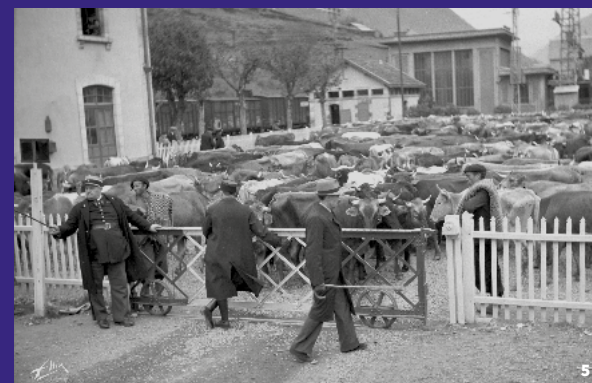
3. Vie quotidienne à Azet