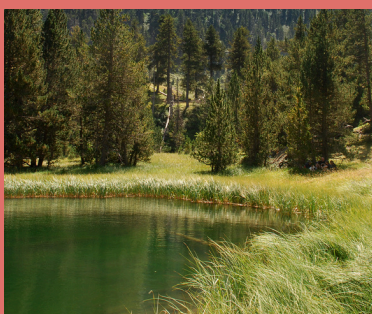
Ibón de Batisiellas