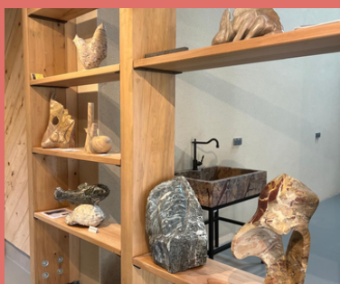
Taller de marmol en Ilhet

Des partenaires engagés dans leur territoire, son développement socio-économique et l'environnement, unis pour mettre en place une véritable coopération transfrontalière à travers la création de produits touristiques communs. Pyrénées Sobrarbe Aure-Louron est le sceau et le projet DUSAL+ est l'outil de nos réalisations.