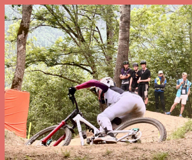
Copa mundo BTT Loudenvielle